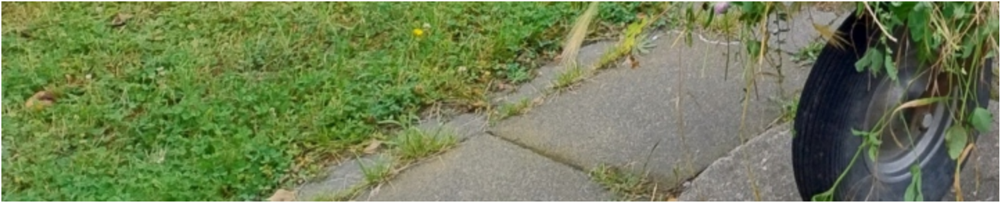
Eugen kam mit dem Abtransport von Gras, Kräutern und Unkraut kaum nach.